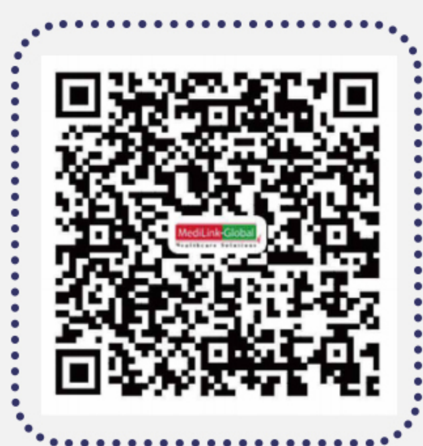
除外医疗机构/医生清单