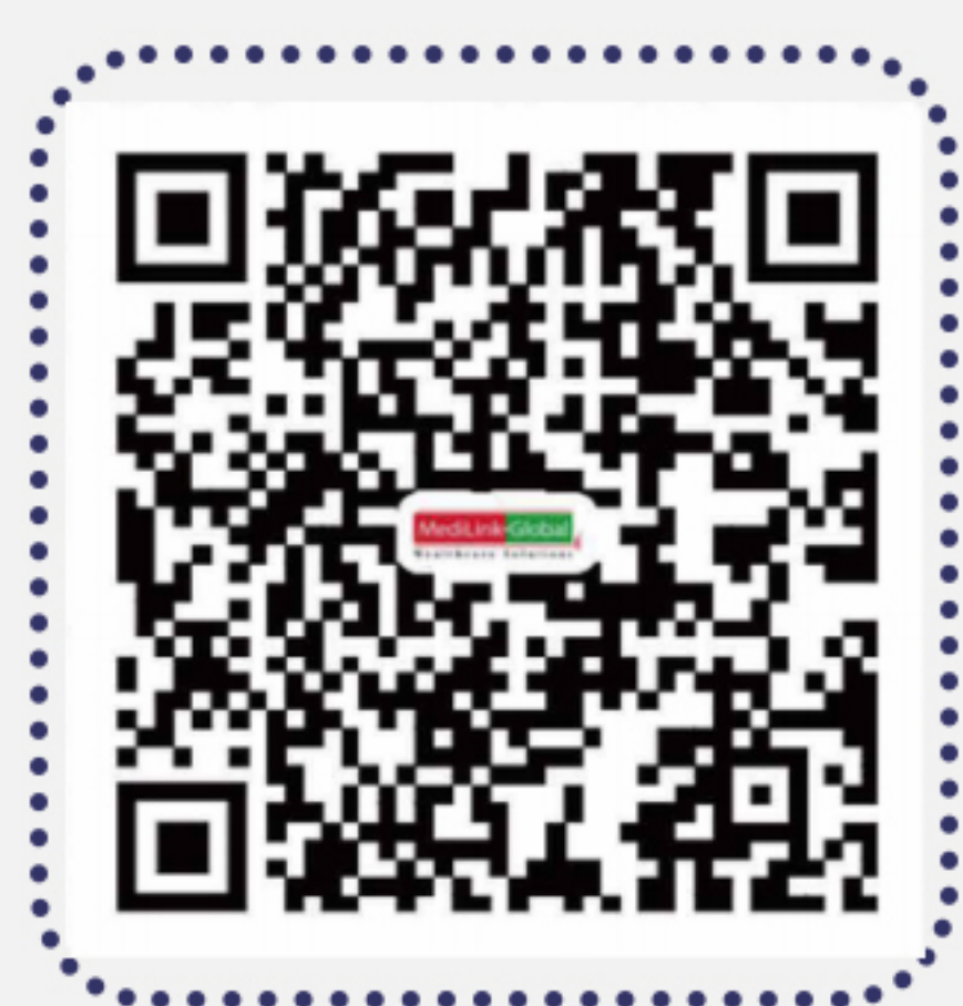
中间带网络医疗机构清单

中间带医疗旗下 (医杏门诊部，百诺门诊部，宜汇门诊部) 上海百汇医疗 上海全康医疗中心